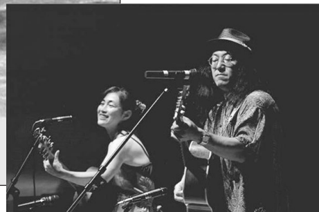
国分寺エクスペリエンス