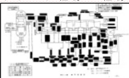
福一2号基 熱平衡線図