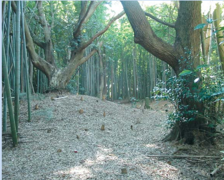
鎌倉街道にある塚の上に立つスダジイの巨木

また、開発により今では700メートルしか残っていませんが、鎌倉街道がある里山はいろいろな野鳥や植物や巨木の宝庫です。豊かな自然にあふれた古の道を多くの人に知らせ、みんなに親しんでもらおうとこのパンフレットをつくりました。