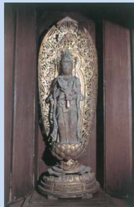
木造観世音菩薩立像

奈良時代の僧である行基が、観音経を唱えながら三日三晩寝ずに彫り上たと言い伝えがあり、町指定文化財である。