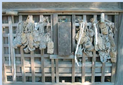
山門仁王像前にぶらさがるわらじ