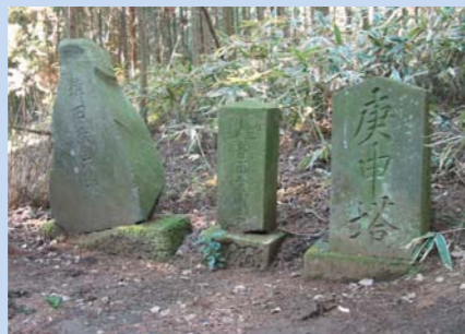
鎌倉街道にある庚申塔

庚申の夜、身体の中にすんでいるという三匹の虫が帝釈天に悪い知らせをするので、その夜は虫がでないように徹夜をする“おひまち”という習わしがある。