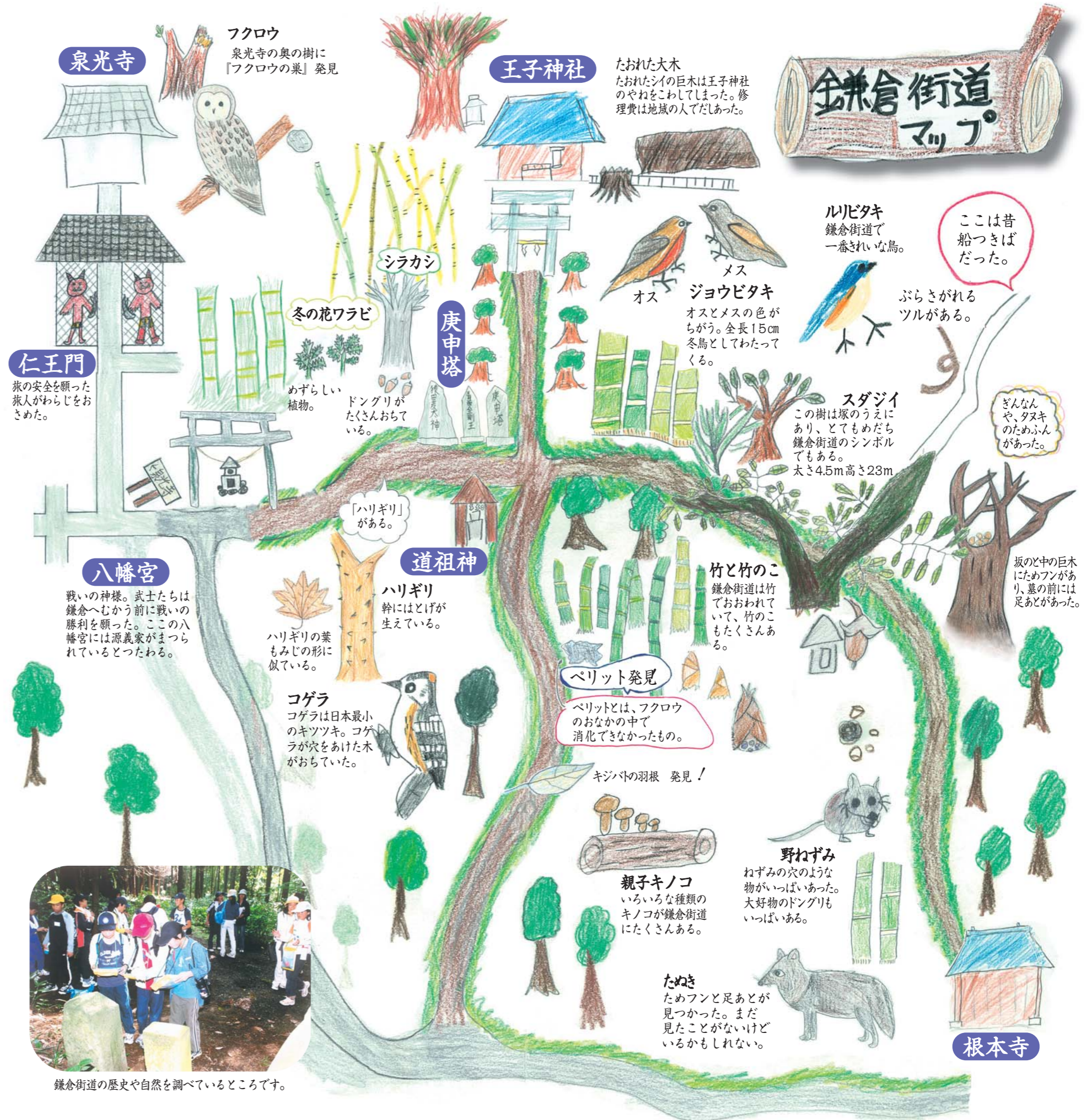
鎌倉街道の歴史や自然を調べているところです。

また、現在鎌倉街道が残る森は自然が大変豊かで、この貴重な利根町の自然を後世まで伝えていきたいものです。