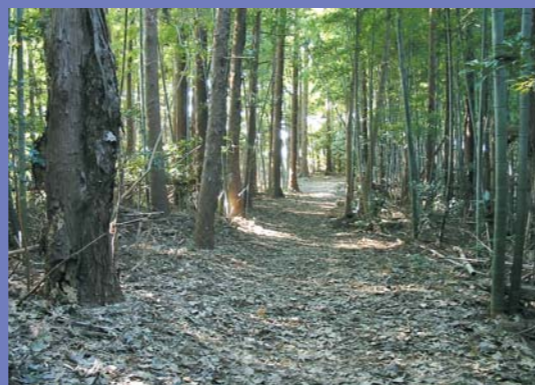
今も残る700mの鎌倉街道