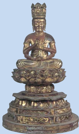
両界大日如来坐像