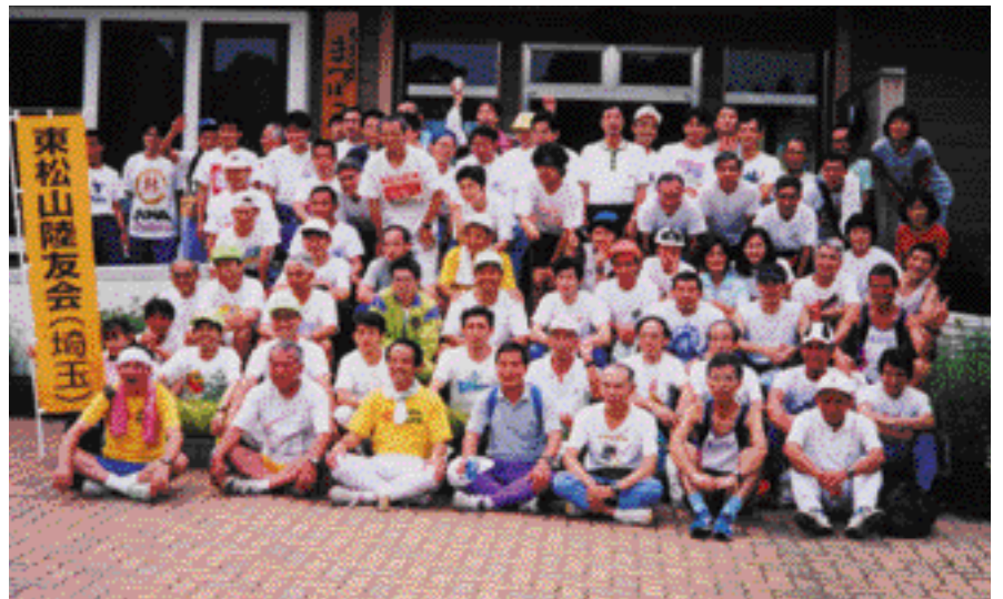
合同練習会での記念写真