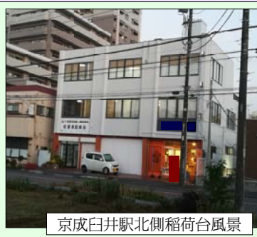
京成臼井駅北側稲荷台風景

そして、旧統一教会と政治家 の癒着が議会でも問題になっ ています。宗教団体という組織力 を活用し、選挙などに介入し、 政治家の力を利用して、自らの 地位に力をつけようとしていま す。また、政治家はその力を利 用し、反社会性を無視し、選挙 で成功を収めようとしており、 問題とされています。