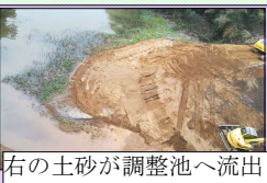
右の土砂が調整池へ流出

この橋の下部は明神台調整池。これらは、急峻な崖っぷちに作られており、今後の風雨等により、更なる被災が懸念されています。