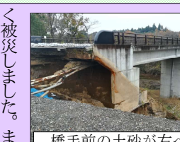
橋手前の土砂が右へ流出

急峻な地形にある橋と調整池が被害を受け、その復旧に苦勞しています。今後の度重なる被害も懸念され、責任は市だけかかっています。