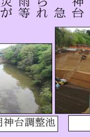
崩落部の法面工事

これまでの経費として明神橋復旧工事約6.4億円、明神台調整池工事は約2.3億円(内1億円は千葉市負担)が執行予算化済み。市長は多額の金がかかる可能性があるとして、最終金額は不明と担当部長も議会で述べています。