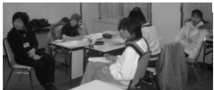
グループ討議・むこうのグループではどんな話が？