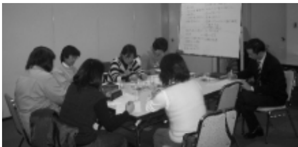
グループ討議・ホワイトボードを使いながら