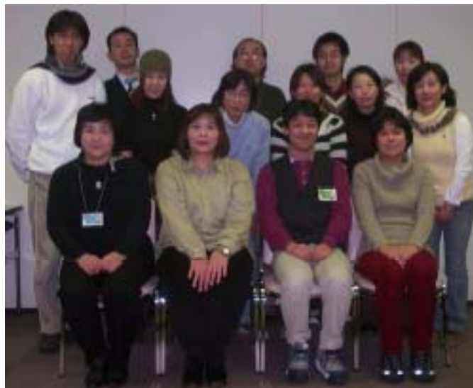
第3分科会のホームページ【期間限定】

http://www.asahi-net.or.jp/~hn8m-szk/03pre3/