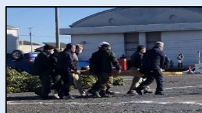
担架による怪我人搬入