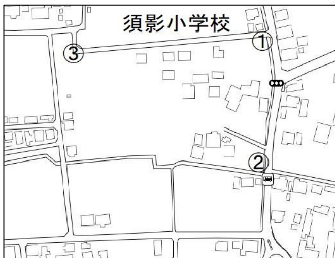
カーブミラー設置予定場所