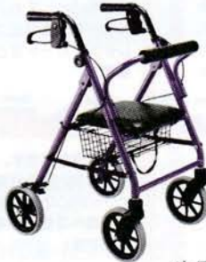
パープルメタリック