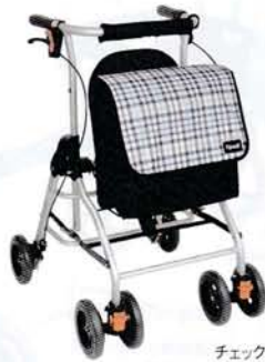
チェックブラック