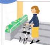
階段、ポーチ部 などの移動時