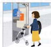
公共交通機関の 利用時