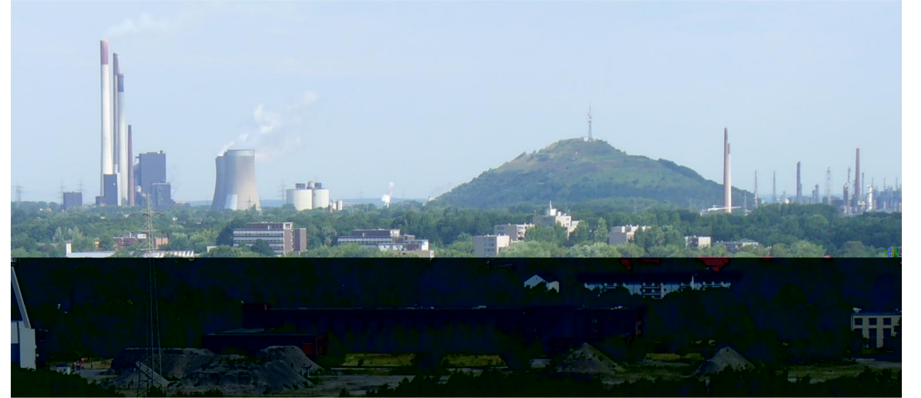
ボタ山と発電所 Ruhrgebiets-Landschaft: Halle mit Kraftwerk, Gelsenkirchen

Größter Ballungsraum Deutschlands mit etwa 5 Millionen Einwohnern. Die traditionell vorherrschende Montanindustrie (Kohle und Stahl) ist seit Jahrzehnten vom Strukturwandel stark betroffen, die letzten beiden Zechen werden bis 2018 geschlossen, Stahl wird nur noch in Duisburg produziert. Industriekultur und Industrietourismus sollen dem Ruhrgebiet ein neues Image geben und teilweise auch für neue Arbeitsplätze sorgen.