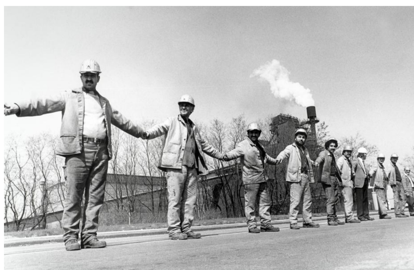
Proteste gegen die Schließung der Henrichshütte in Hattingen (links) und des Stahlwerks Rheinhausen in Duisburg (rechts), beides 1987

Boom der historischen Regio-Kriminalromane in den letzten Jahren. Vergleiche mit Regionalkrimis aus anderen Regionen.