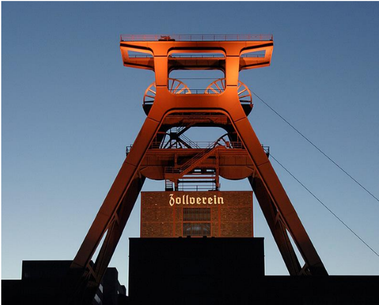
世界遺産 Weltkulturerbe Zeche Zollverein, Essen

Ein Kriminalroman, der in einer bestimmten Region spielt, die im Roman auch oft genannt wird. Die Kategorie Regiokrimi ist oft ein Marketinginstrument für den Verkauf in der Region.