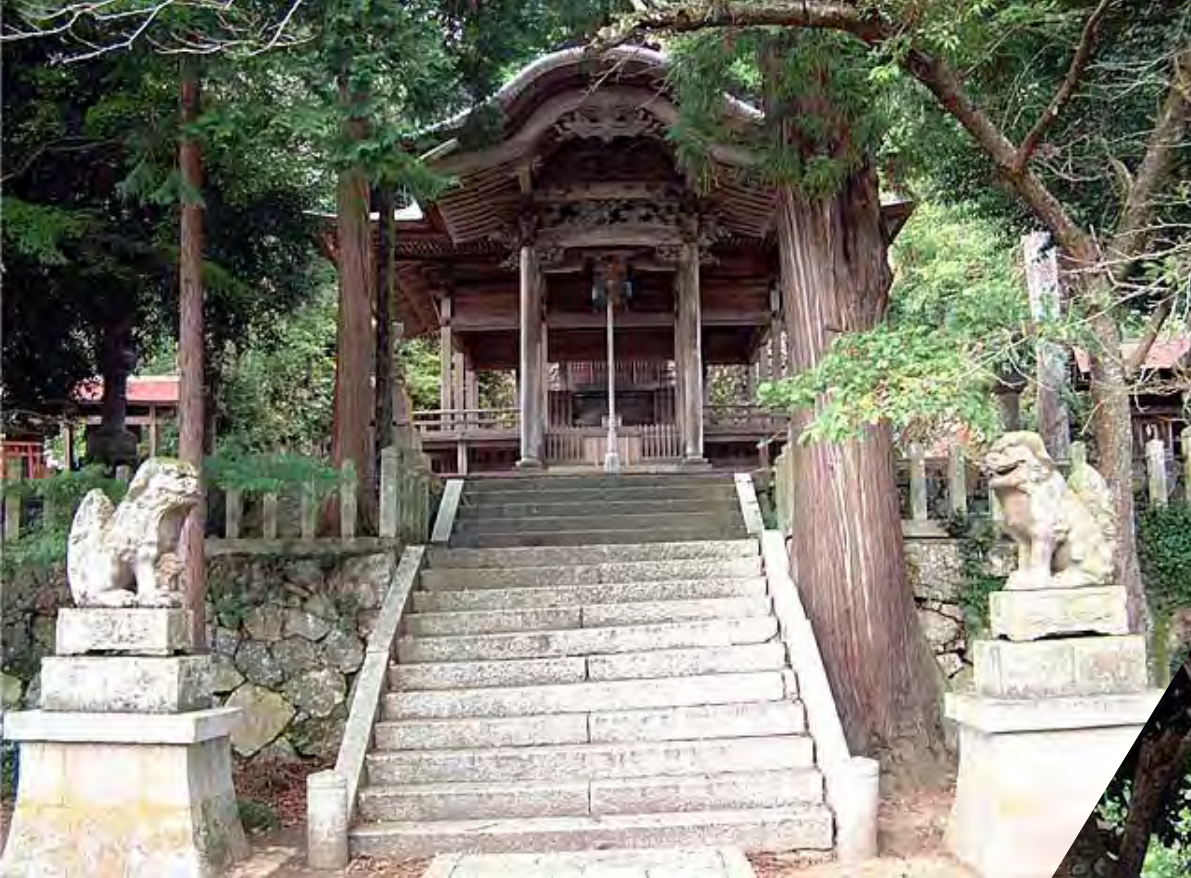
福知山 生野神社のこま犬