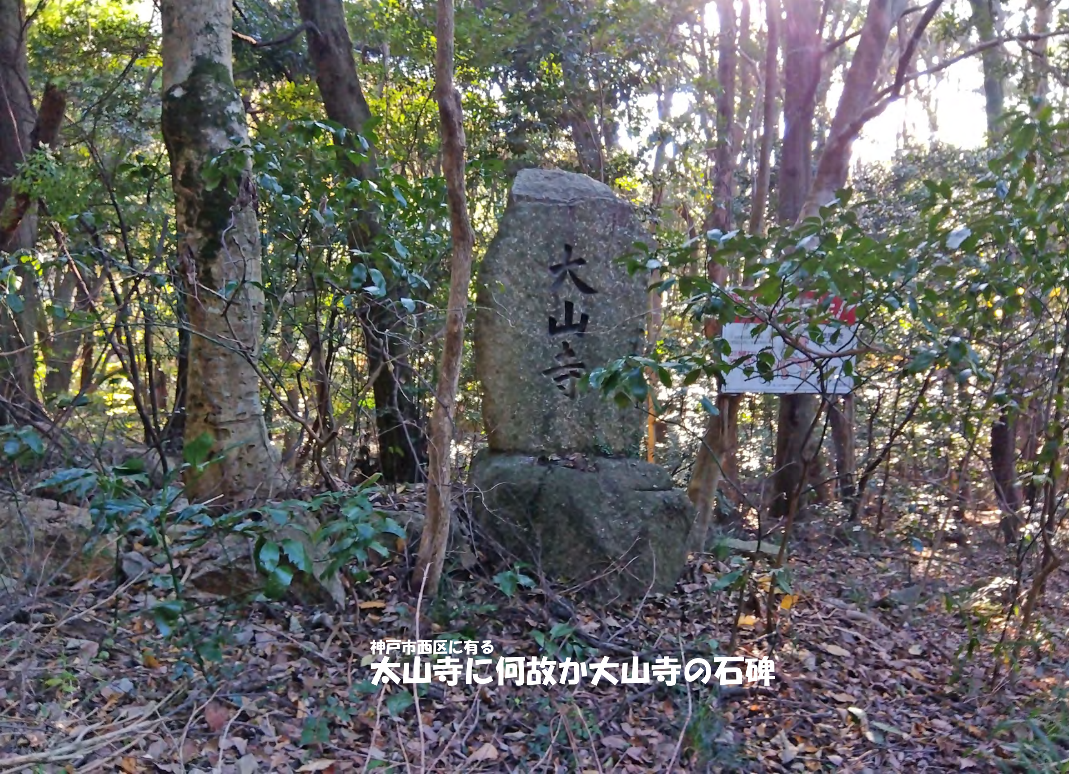
神戸市西区に有る 太山寺に何故か大山寺の石碑