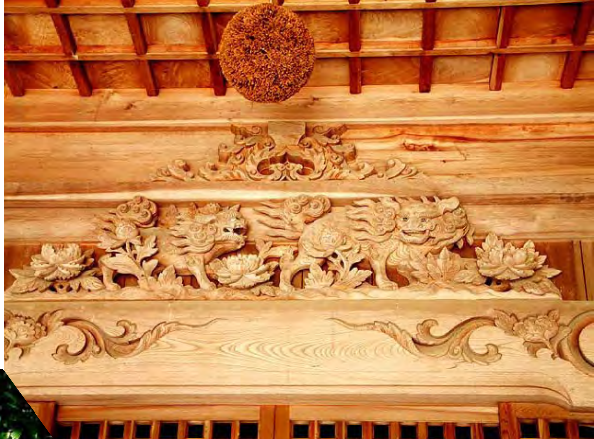
社町牧野 神社に杉玉 酒好きの神様?

It is Sugitama to a shrine. A heavy drinker's God?