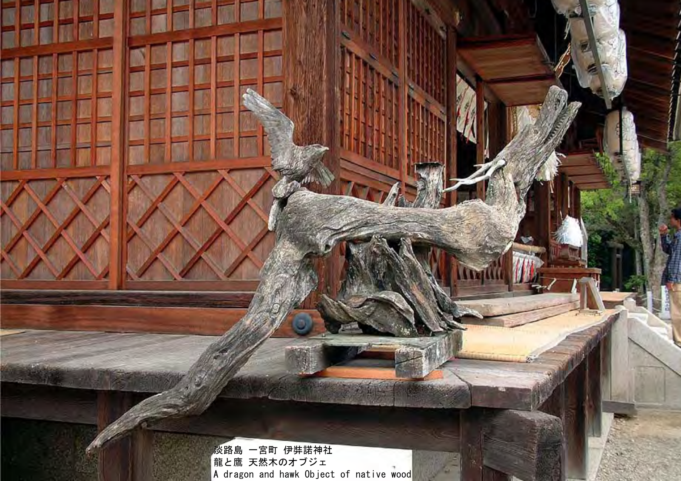
淡路島 一宮町 伊弉諾神社 龍と鷹 天然木のオブジェ A dragon and hawk Object of native wood