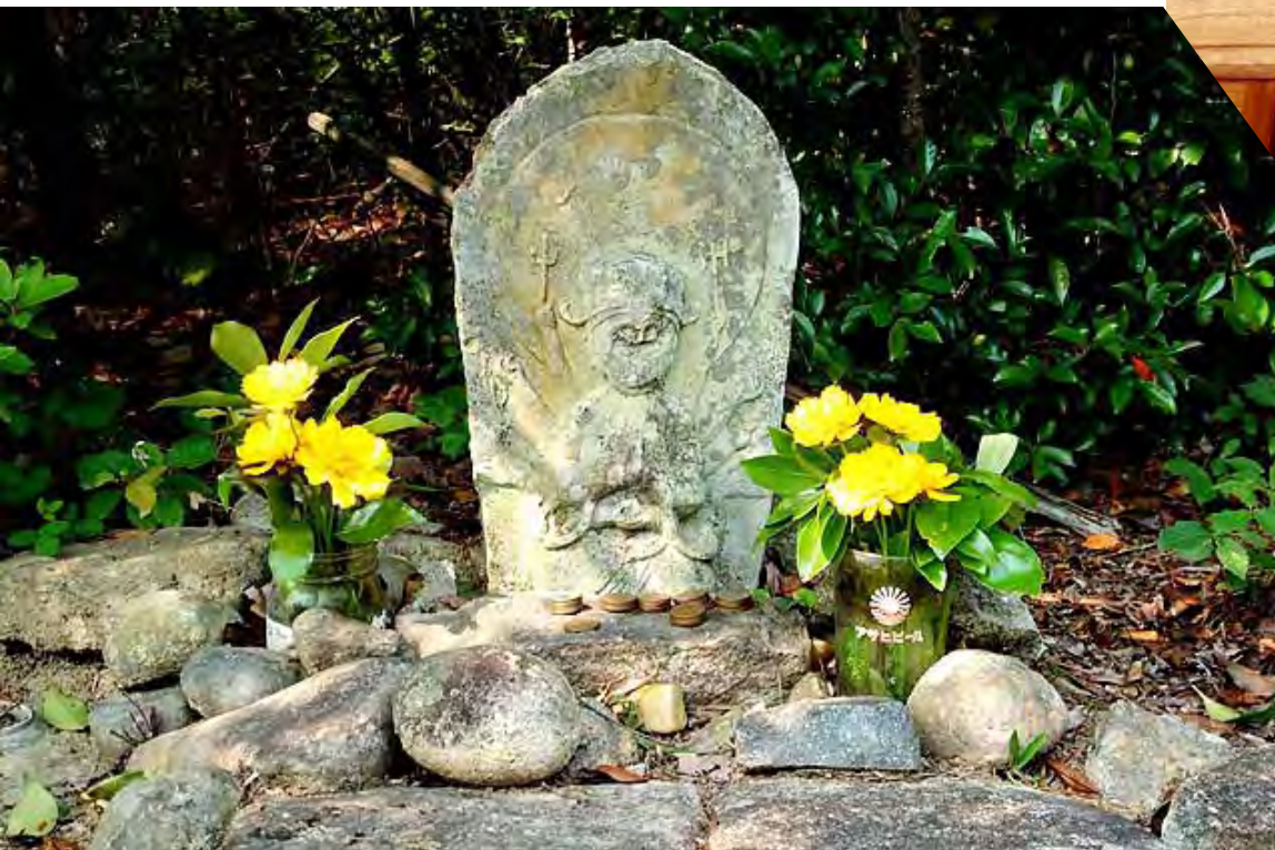
社町上久米 パーマをあてたお地藏様? The stone statue of the Buddha to which the permanent wave was hit