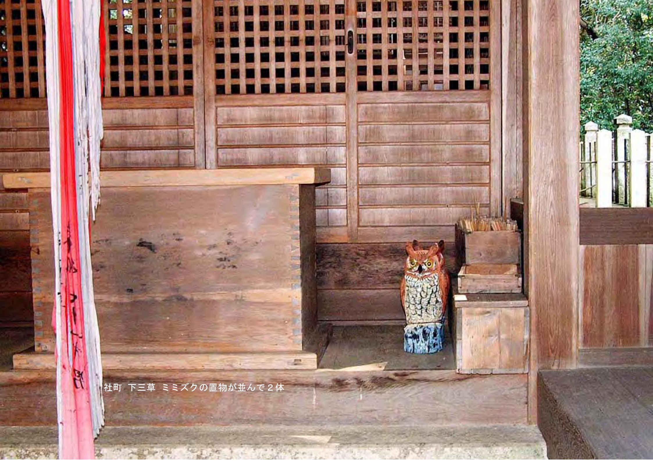
社町 下三草 ミミズクの置物が並んで2体