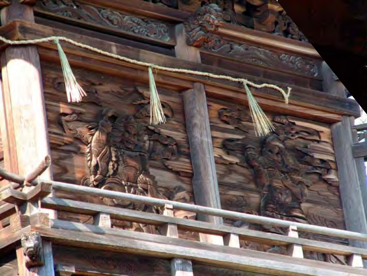
香川 滝宮神社の瓦 Takimiya shrine