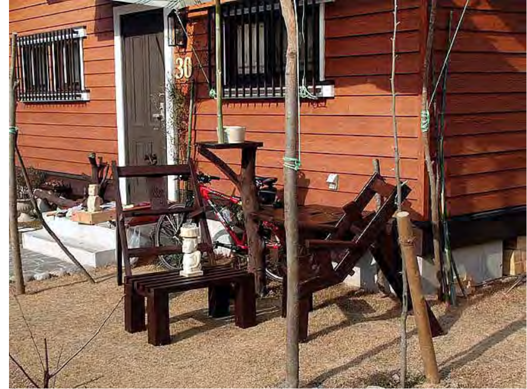
MOAI image of the 1st body It also becomes an ashtray. Republic of Chile Easter Island