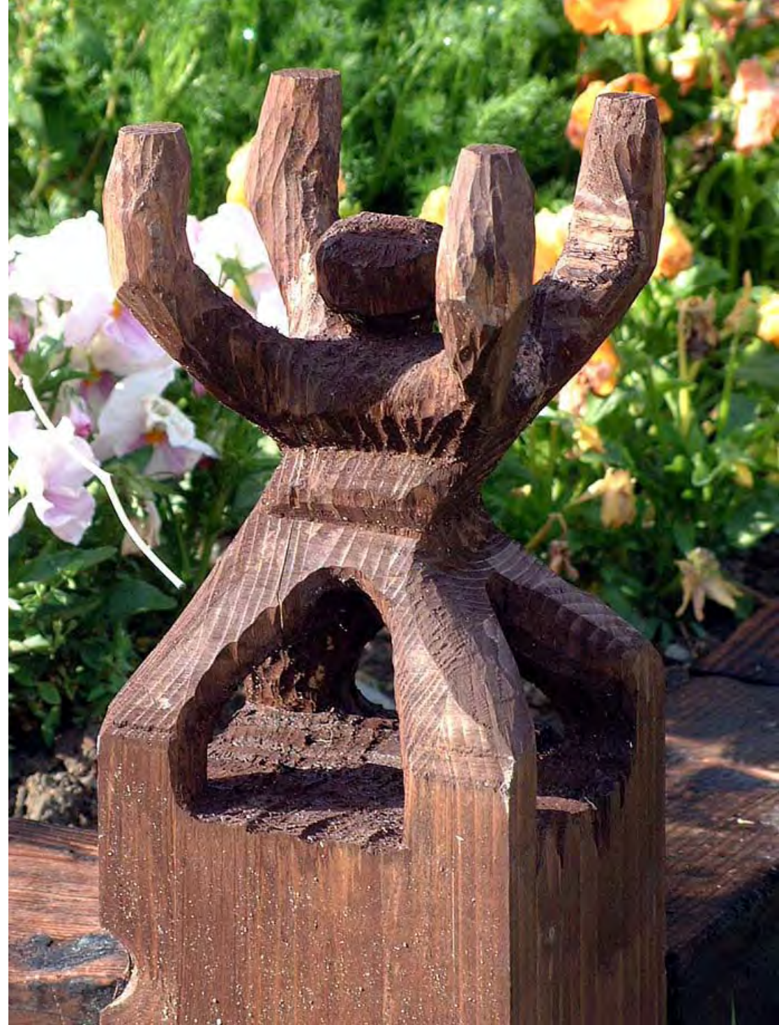
力持ち (ギブアップかな) a strong man (or give up???)