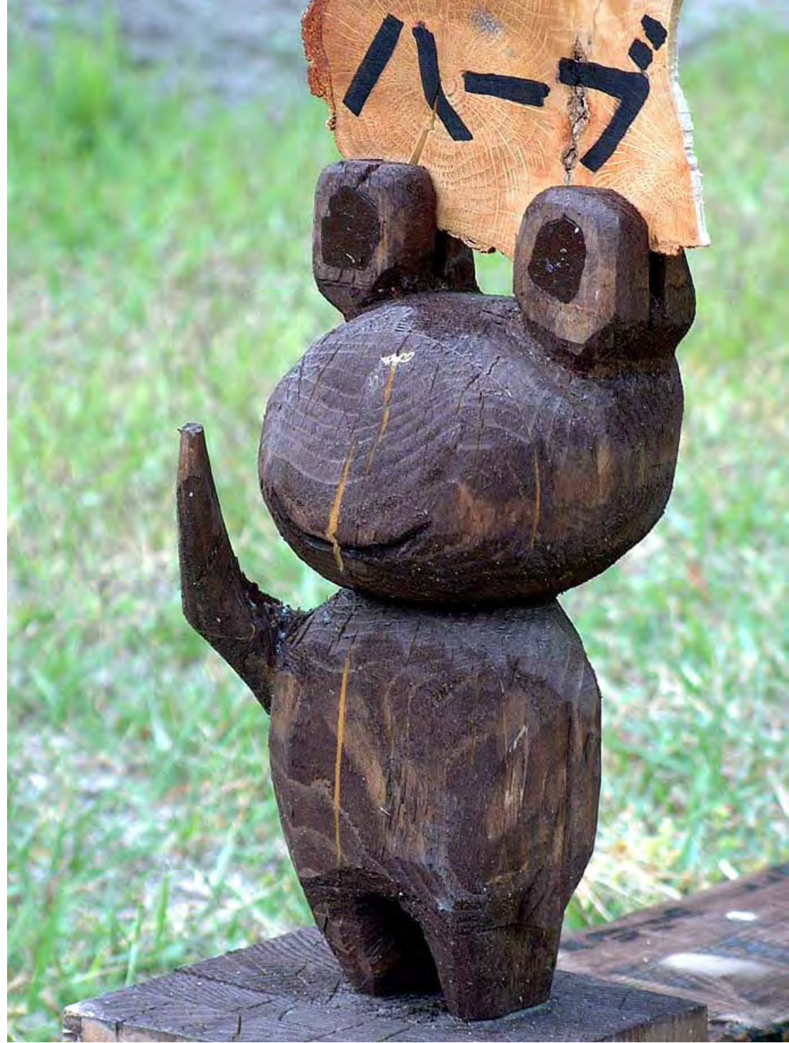
カエル a frog