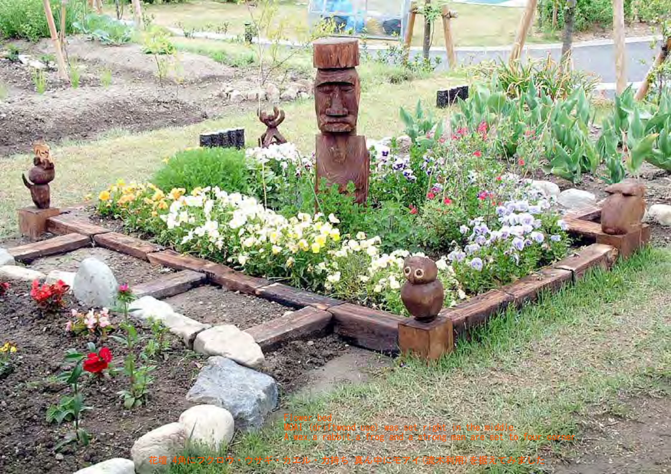
Flower bed MOAI (driftwood use) was set right in the middle. A wax, a rabbit, a frog and a strong man are set to four corner.

花壇 4角にフクロウ・ウサギ・カエル・力持ち 真ん中にモアイ(流木利用)を据えてみました