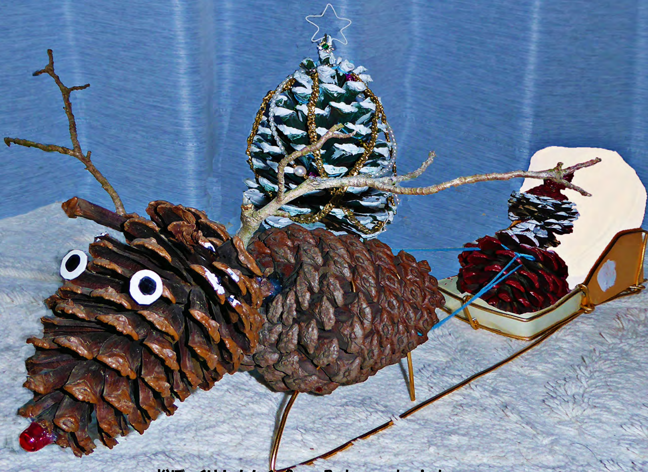
2018.05.24 松ぼっくりトナカイ Cone Red-nosed reindeer