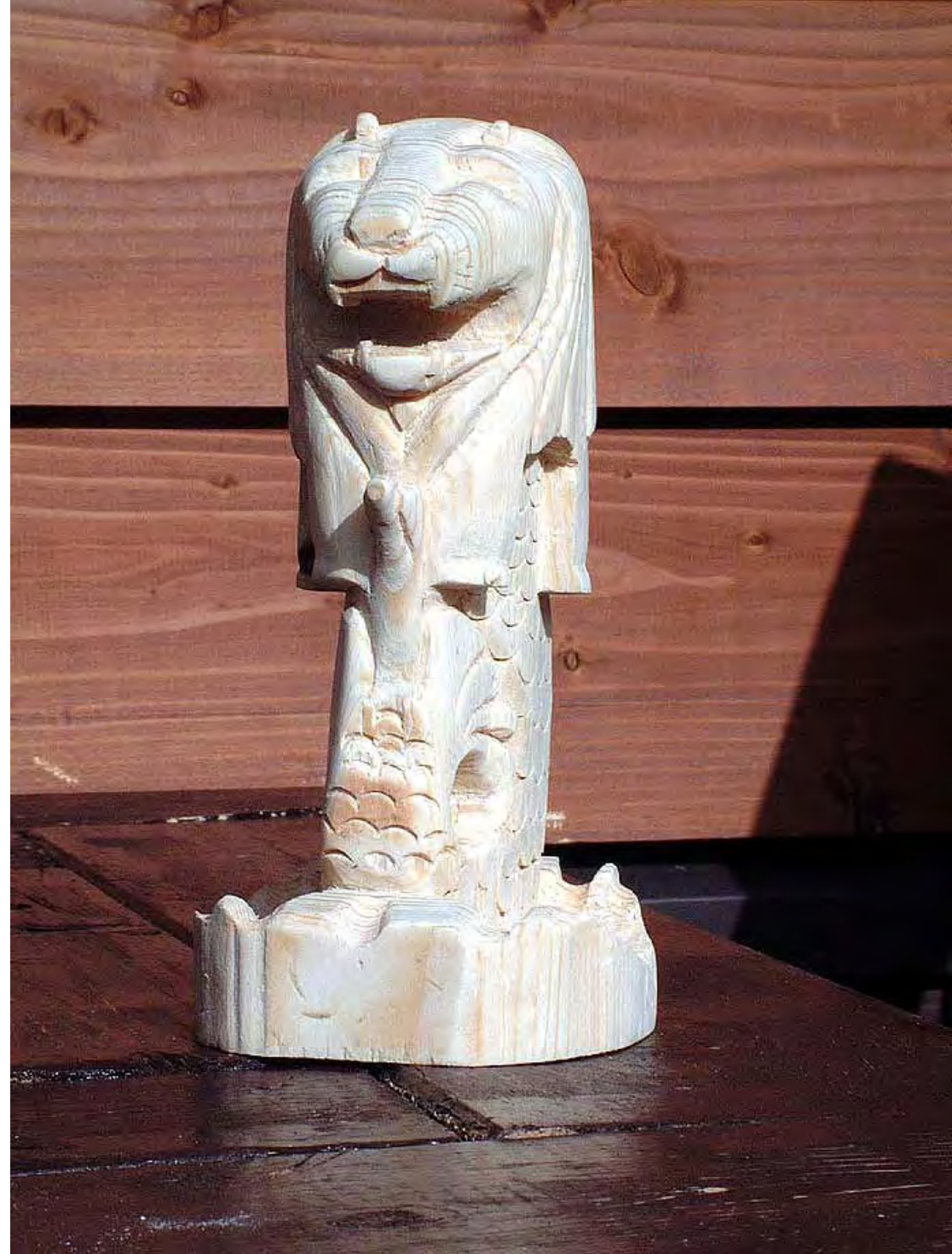
マーライオン シンガポール Merlion Singapore