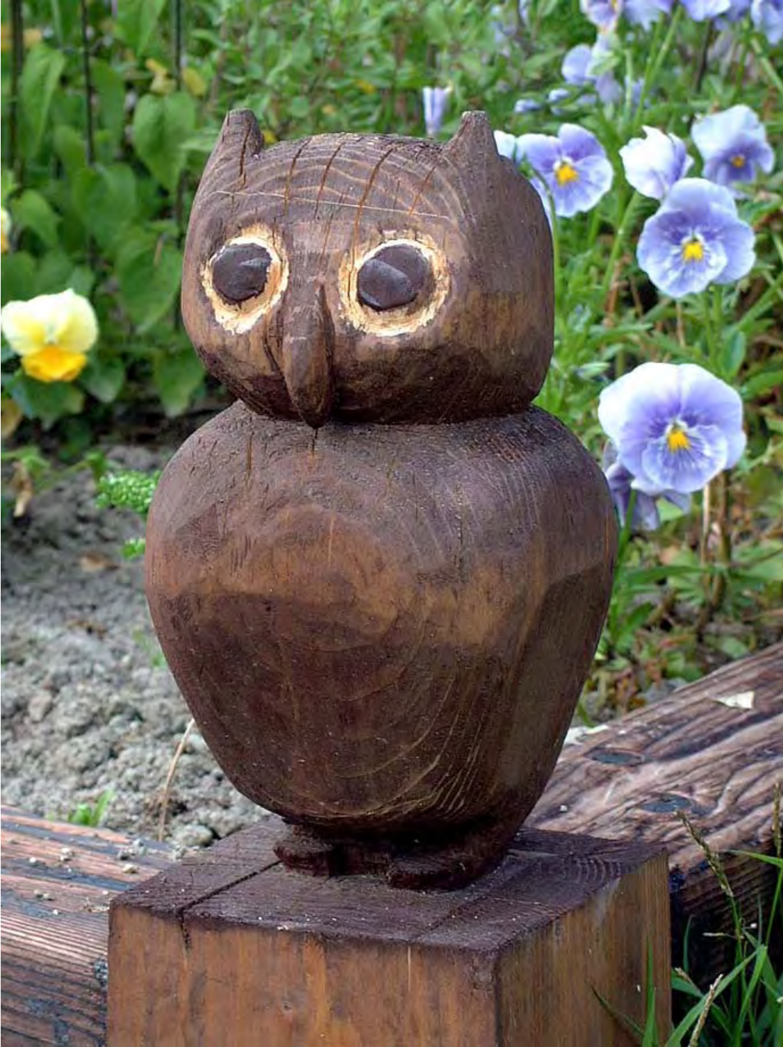
フクロウ A wax