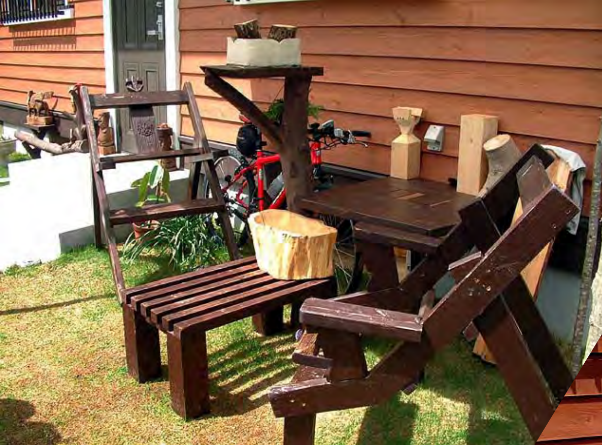
台風で倒れた木を利用したオブジェ

The object and chair in front of the door