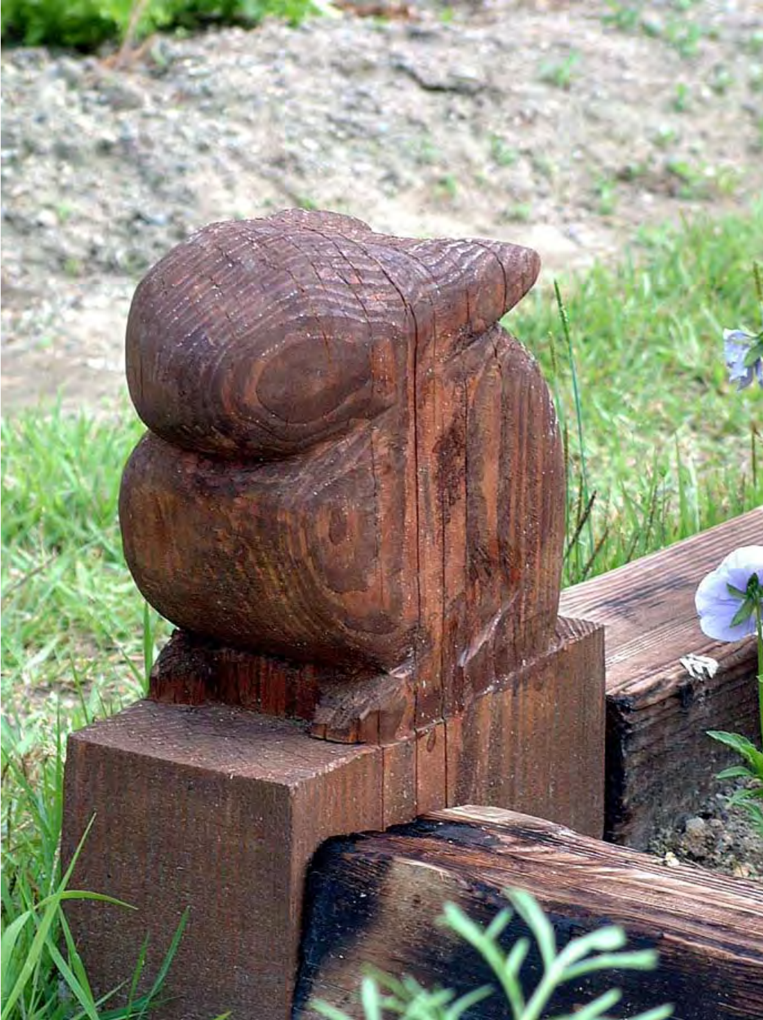
ウサギ a rabbit