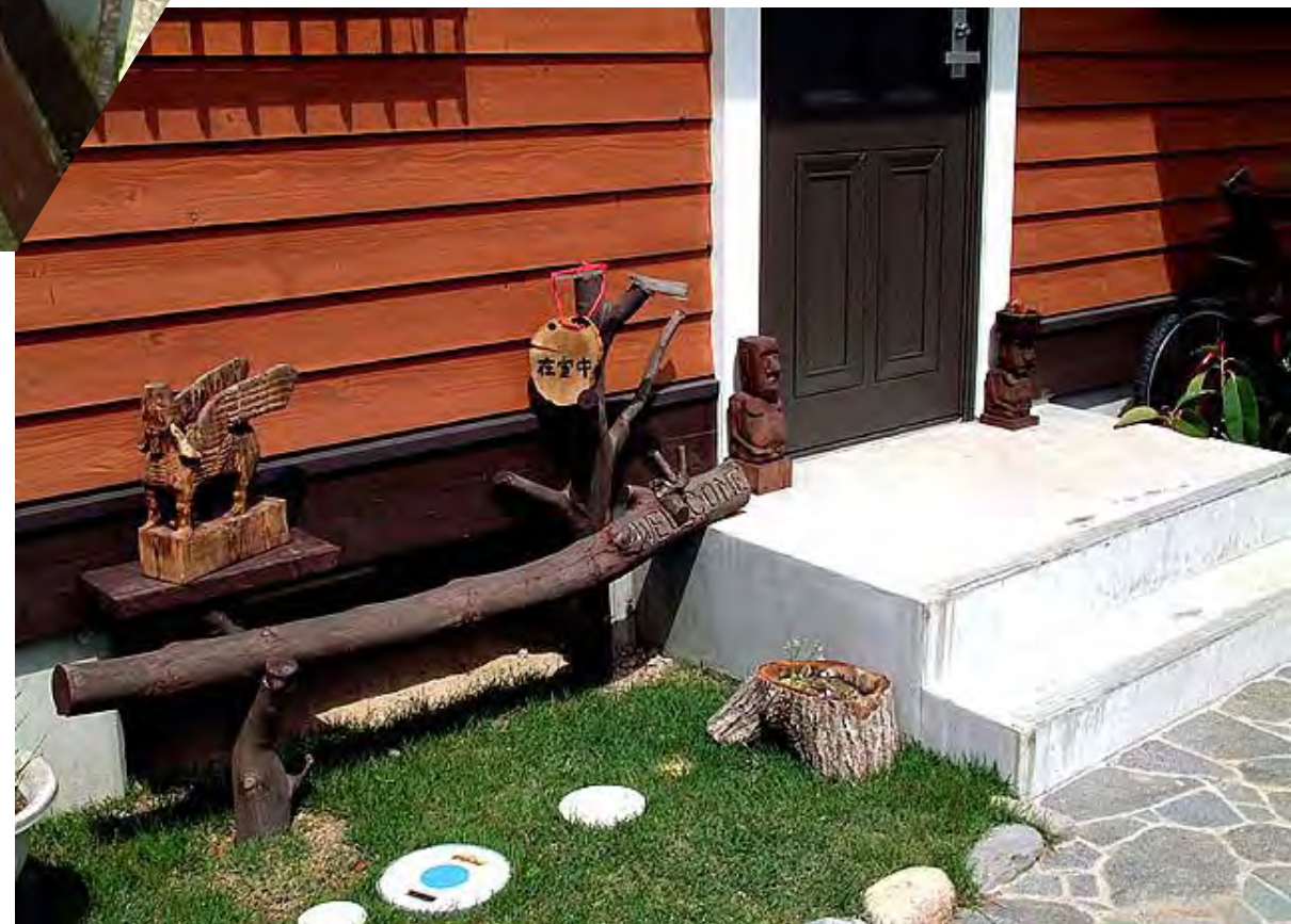
上 フルーツポット製作中 下 クヌギの切り株を利用した植木鉢と在宅表示

The object and chair in front of the door