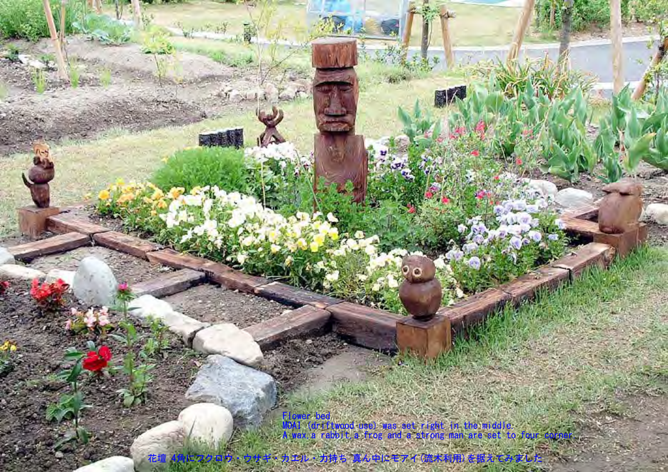
Flower bed MOAI (driftwood use) was set right in the middle. A wax, a rabbit, a frog and a strong man are set to four corner.