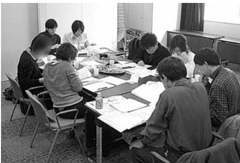
Fig. 1 Small group discussion in the workshop

注)参加者のプライバシーに配慮し,写真の一部を加工した.個人識別可能な参加者からは写真掲載の承諾を得ている.