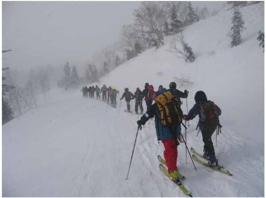
梅池自然園付近の登り