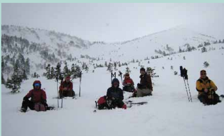
八甲田（箒場コース）にて