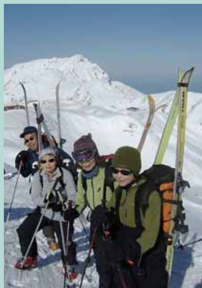
立山（大日岳を背景に）