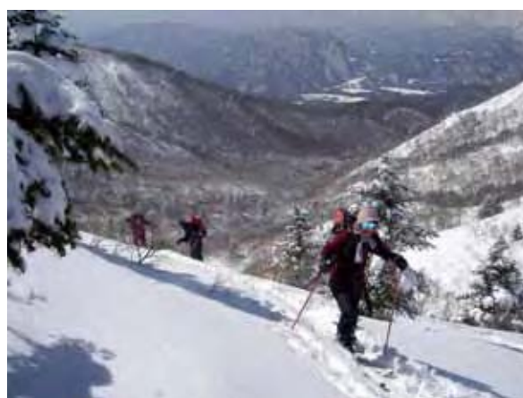
コルから飯縄山への登り

4日(土)は黒姫倶楽部を午前9時過ぎに出発。戸隠スキー場の中社ゲレンデに10時前に到着しリフトを3本乗り継いでスキー場トップの瑠璃山(めのうさん)山頂に午前10時40分に到着した。瑠璃山と飯縄山との鞍部までまずは滑り降り、そこからシールを付けて登り返し、午後1時半過ぎには全員が飯縄山山頂に到着した。山頂からは眼前の戸隠山をはじめ、北アルプスの嶺峰、妙高山や信越国境の山々が一望でき、しばし昼食休憩を取りながら、展望を楽しんだ。