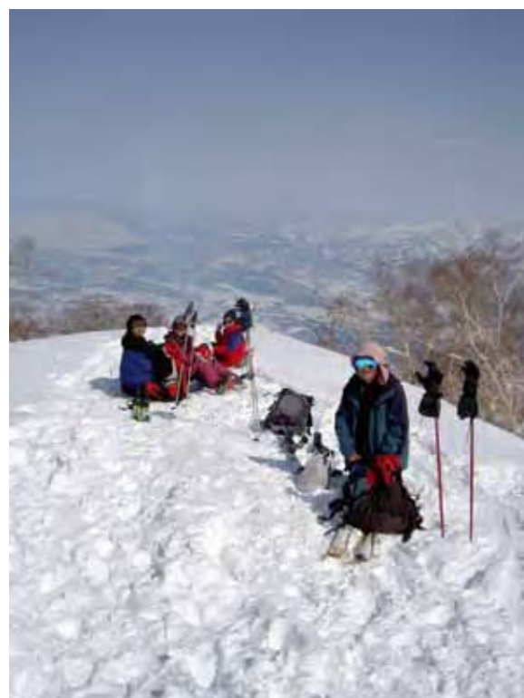
尾根に到着。大休憩

までのトラバースでは、またもトレースに導かれてミスコースし、最後に階段登高が待っていた。