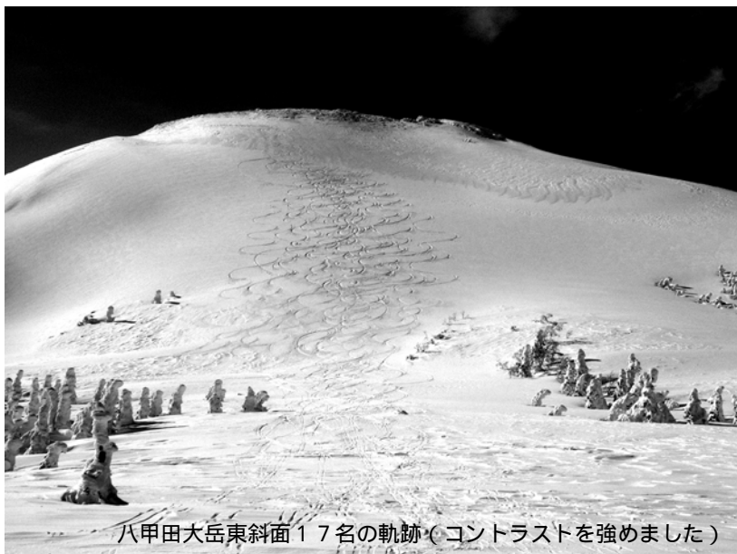
八甲田大岳東斜面17名の軌跡(コントラストを強めました)