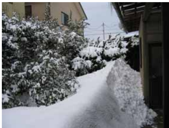
我家(川崎さん宅)の庭にも 50cm を超える積雪

海岸から約 3km にあって、通常そう多くない我が家の庭にも 50cm を超える積雪がある。スキー場の一部はリフト下の除雪が追いつかずクローズするありさま。おかげさまでエリア共通パスを活用しとりあえず全 8 箇所をひとまわりの予定。各スキー場とも圧雪が追いつかず未整地の斜面が残っていて楽しめる。今シーズンから新しい板を購入、Volkl 製の Snow-wolf というスリーサイズ 113-76-100 の山スキー用、オフピステの使い勝手は良さそう。