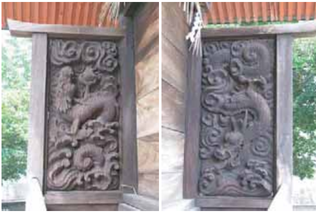
本殿脇障子の彫刻