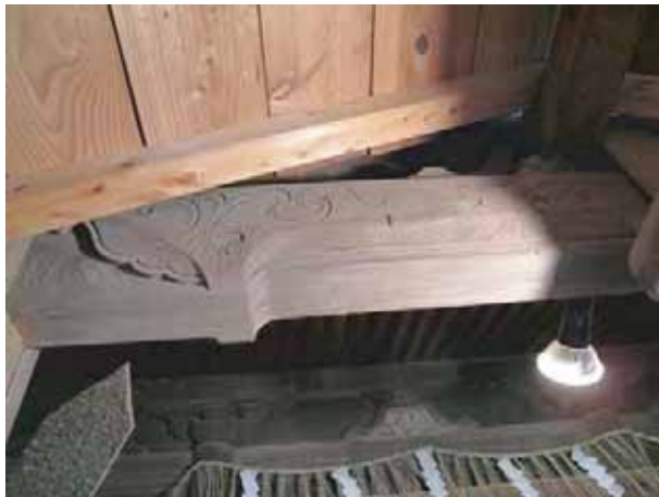
本殿向拝虹梁絵様