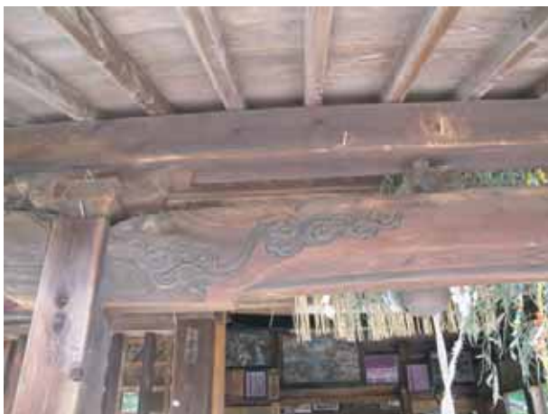
拝殿向拝虹梁絵様