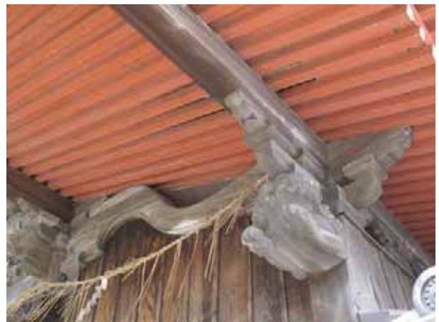
垂木と海老虹梁、獅子の彫刻