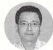
Happy Life 78

だけでなく、口臭の原因を取り除き、歯の寿命を延ばすことができます。生涯にわたり自分の歯でかめることで、食生活が充実するだ